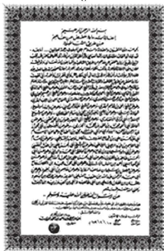
Versos de la versión estándar del Corán que deriva directamente del Corán autorizado por Otmán, quien mandó destruir todas las demás versiones.