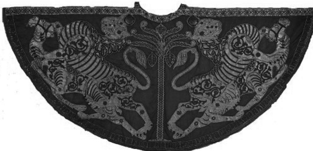
Imagen extraída de: The Norman Kingdom of Sicily , (El reino normando de Sicilia), D. J. A. Matthew (1992).

Capa ceremonial, ricamente bordada en seda y confeccionada en un taller real para Roger II poco después de su coronación. La inscripción árabe del borde honra y aprueba su gobierno, deseándole lo mejor para el futuro. La imagen en la capa muestra leones atacando a camellos.